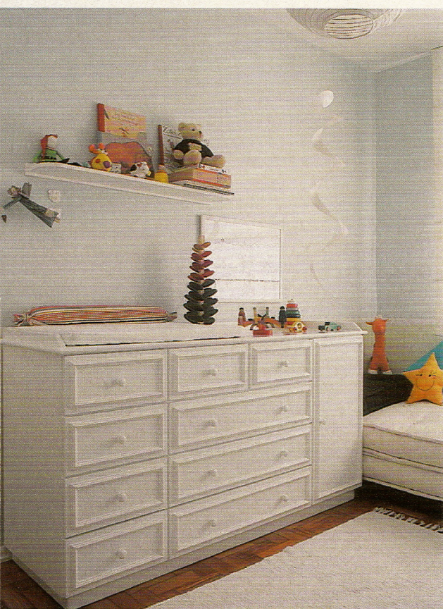
A cômoda da Per Bambini guarda todas as roupas e exhibe os brinquedos. Móbile da Imaginarium.

Cores repousantes, clima de aconchego, marcas da família em todos os cantos. Nesse mundo cresce o esperto Nicolás.