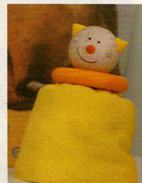
O fantoche de bichinho veio das últimas férias na Suíça.